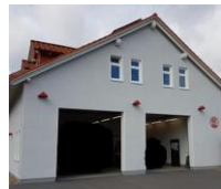
(Beispiel Bild) Feuerwehrhaus Bad Arolsen - Schmillinghausen Baubeginn: 2021 gepl. Kosten 900 T EUR