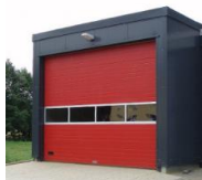
(Beispiel Bild) Zusätzlicher Stellplatz