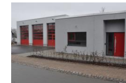
Feuerwehrhaus FF Volkmarshausen Kulte Fertigstellung: 2021 Kosten 930 T EUR (Quelle HNA)