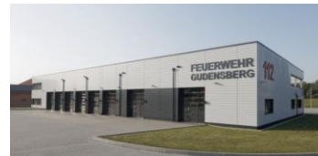
Stützpunkt FF Gudensberg Fertigstellung: 2018 Kosten 5.500 T EUR (Quelle HNA)