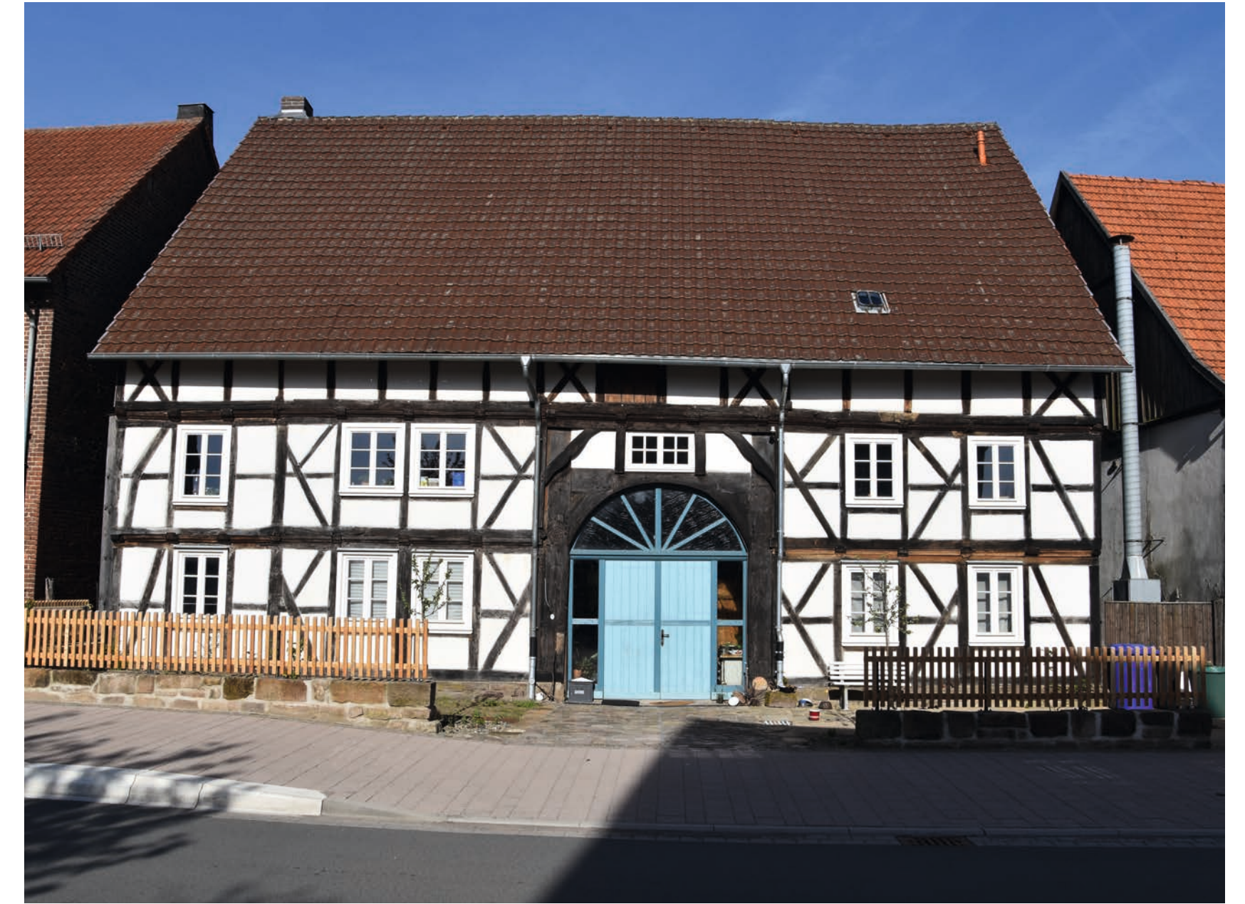
Beispiele sanierter Gebäude.