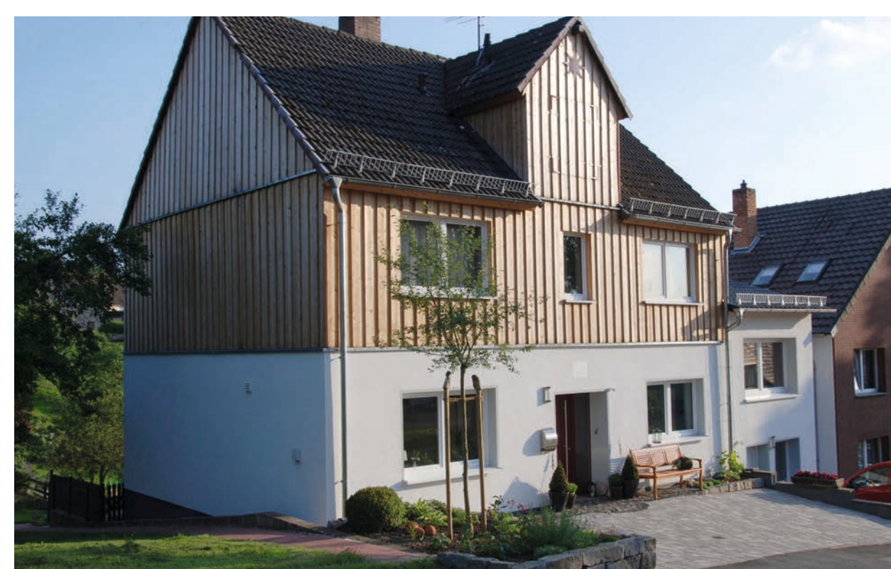
Weitere Beispiele sanierter Gebäude.