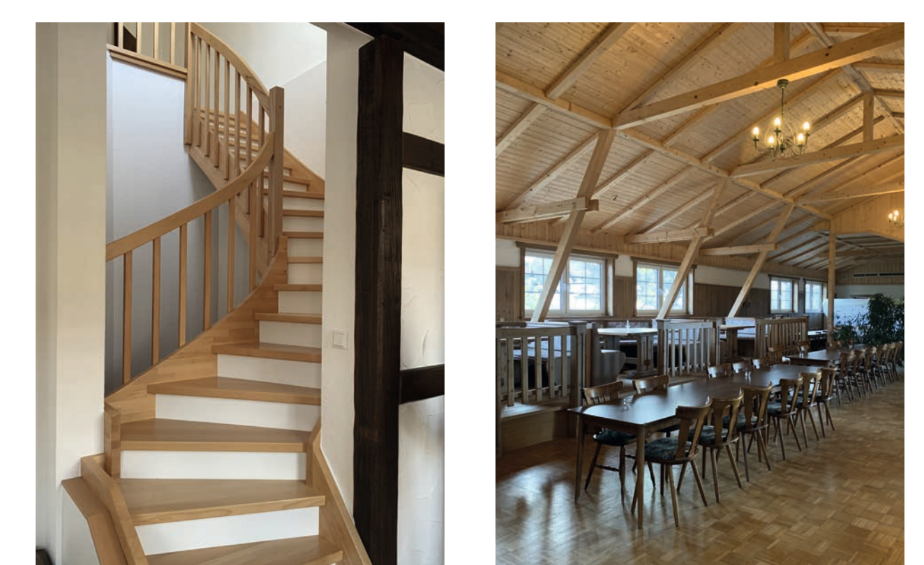
Beispiele für die liebevolle Ausgestaltung von Details und umgesetzte Maßnahmen im Innenbereich.