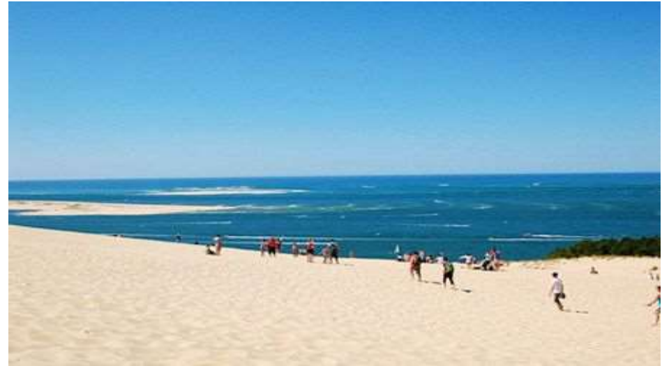
Flussaktivitäten auf der Gironde --- Strand des Atlantik